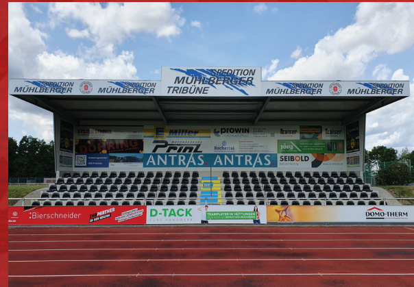
■ An der Tribüne Diverse Pakete