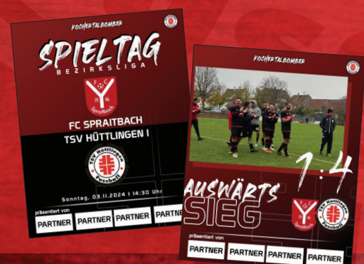
Firmenpräsentation (Logo) im Post „Ergebnismeldung“