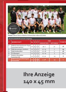
Ihre Anzeige 140 x 45 mm