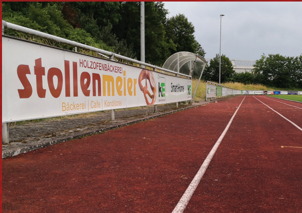
■ An der Bande Höhe 0,75 m, Breite variabel

Mit einem Sponsoring haben Sie die Möglichkeit, Ihr Unternehmen und Ihre Marke einem vielfältigen Publikum in einem positiven und engagierten Umfeld zu präsentieren. Wir bieten Ihnen dabei zahlreiche attraktive Möglichkeiten, um Ihre Präsenz zu steigern und Ihre Zielgruppen direkt anzusprechen.