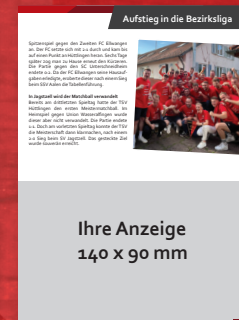
Ihre Anzeige 140 x 90 mm